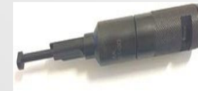
MEMBRANA LDA RQV Dientes 10 Hexágono 14